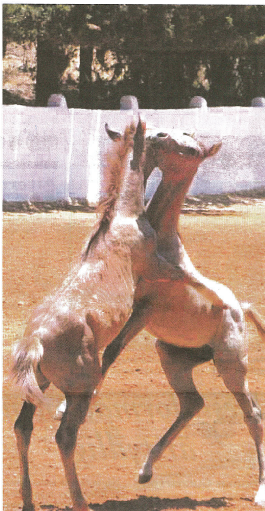
Hästfö.